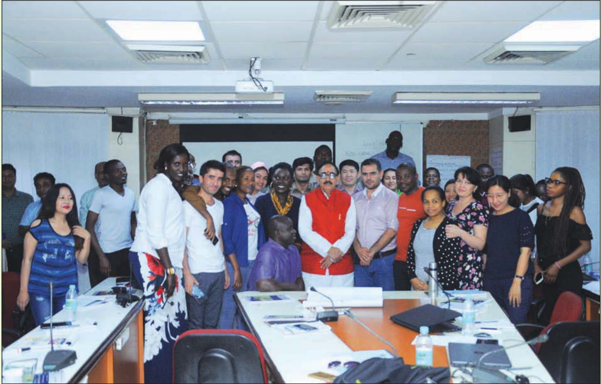
Dr. Mahendra Nath Pandey, Hon'ble Union Minister of Skill Development and Entrepreneurship seen along with the International Participants during visit to NOIDA Campus of the Institute