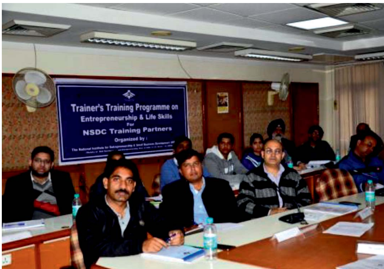
Trainers’ Training Programme on Employability, Entrepreneurship and Life Skills, at NIESBUD NOIDA

The Faculty Development Programme (FDP) was designed to train and develop professionals in entrepreneurship development so that they could act as resource persons in guiding and motivating young S&T persons to take up entrepreneurship as a career. It aimed at equipping teachers with skills and knowledge that are essential for inculcating entrepreneurial values in students, guiding and monitoring their progress towards an