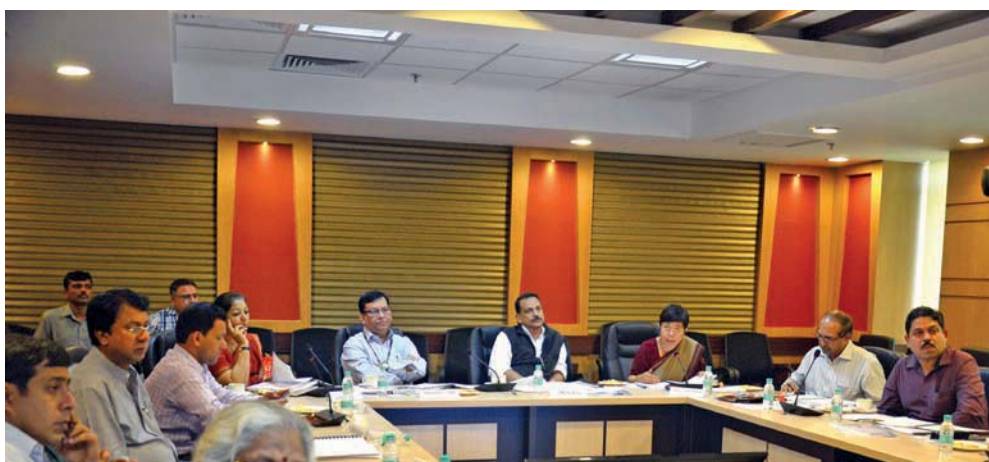
The Meeting of Governing Council in progress