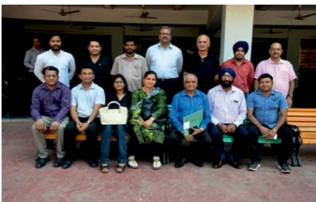
Training Programme on 'How to Raise Finance & Mitigate Risk'

The Institute conducted a total of 10 programmes on Export Procedure; Documentation & International Entrepreneurship and total 166 participants were trained. To strengthen the financial power of entrepreneurs 08 programmes on How to raise Finance & Mitigate risk were also conducted benefitting 119 participants. Looking at the current shopping scenario & to enhance their marketing compatibilities, 41 programmes on Online Marketing & Entrepreneurship were conducted benefitting 505 participants through these programmes.