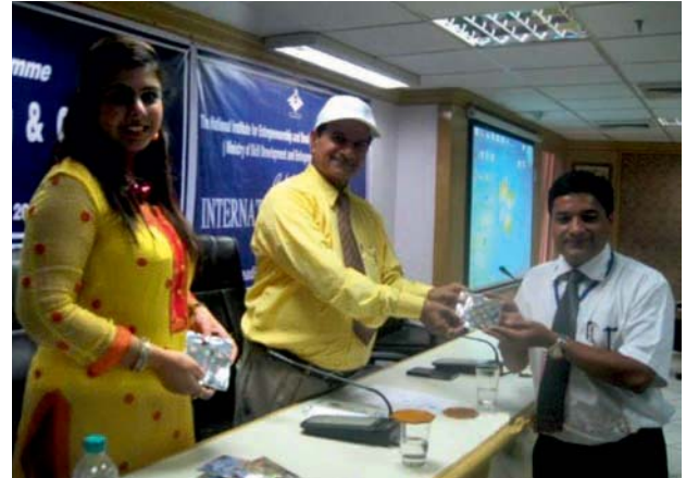
एक अंतर्राष्ट्रीय प्रतिभागी का सम्मान करते हुए

निसबड ने संगठन उन्नयन एवं उत्कृष्टता हेतु नवोन्मेषी नेतृत्व पर अन्तर्राष्ट्रीय प्रशिक्षण कार्यक्रम आयोजित किया जिसमें 26 प्रतिभागियों ने भाग लिया। इस कार्यक्रम की विचार सृजन के संबंध में प्रतिभागियों के नेतृत्व, नवोन्मेषी, समस्या को