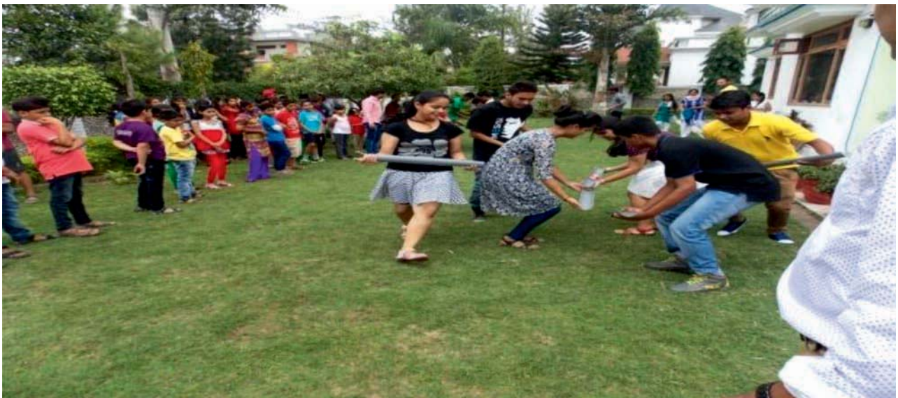
The Summer Camp

The Institute provided a marketing platform to the trained beneficiaries / SHGs / Women entrepreneurs by providing them free stalls at Himalaya Saras Mela at Parade Ground Dehradun, Uttarakhand. The main objective was to strengthen the economy of rural people & to patronize the Self Help Group in the state and provide the livelihood opportunities to them. The Saras Mela provided an opportunity to all the artisans to showcase and market their products. The saras mela is an initiative of the government of Uttarakhand, which provide a platform to the rural artisans to sell their products through exhibitions.