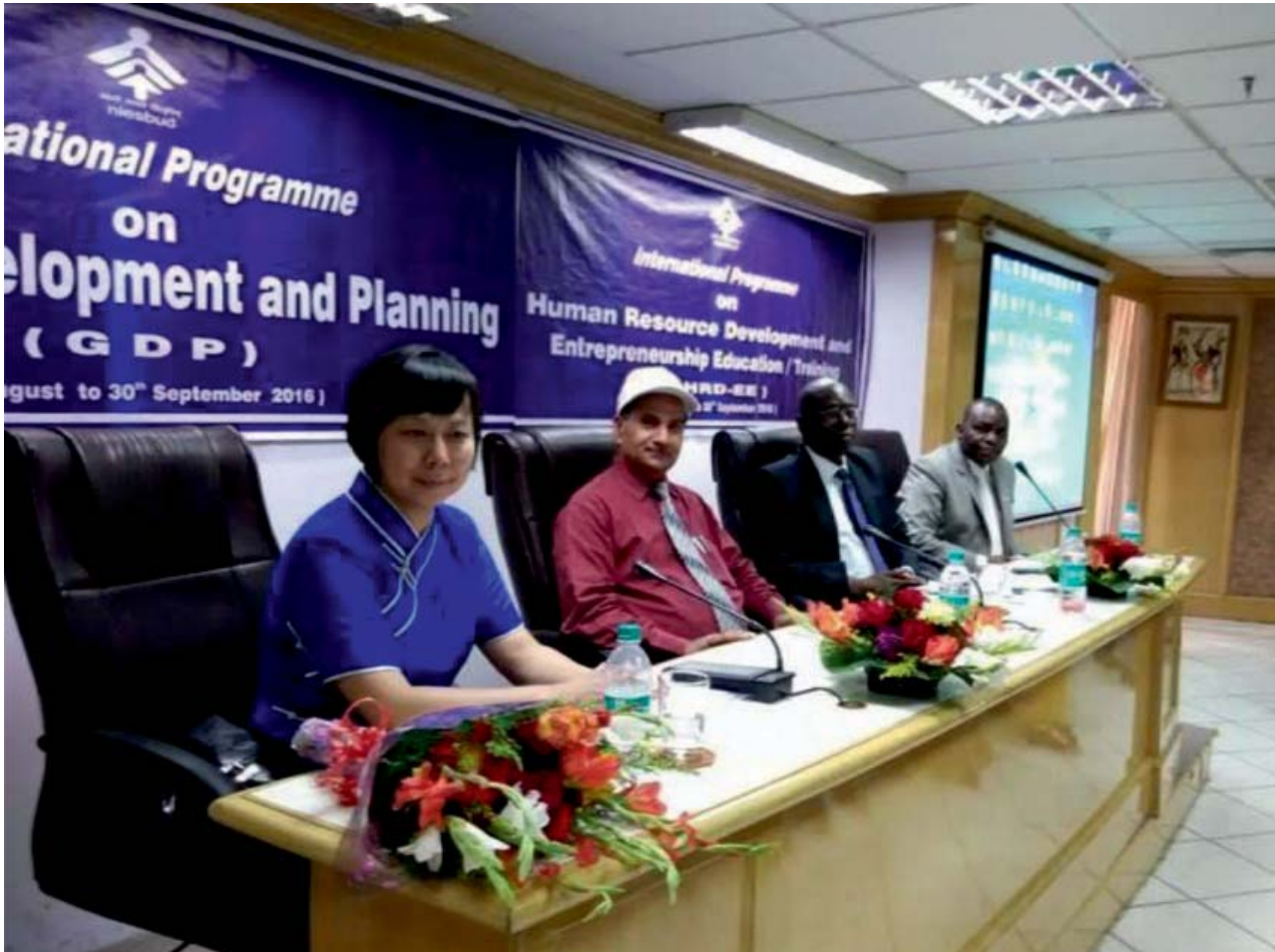
दो अंतर्राष्ट्रीय कार्यक्रमों का उद्घाटन

संस्थान ने एसबीपीपी की 26वीं अन्तर्राष्ट्रीय प्रशिक्षण पाठ्यक्रम को आयोजित किया जिसमें 28 प्रतिभागियों ने हिस्सा लिया। कार्यक्रम को व्यापक विस्तार देने के लिए पाठ्यक्रम की विषयवस्तु को सात प्रमुख मॉड्यूलों जैसे छोटे कारोबार स्थापित करने, छोटे कारोबारों की आयोजना, छोटे कारोबार अवसरों का