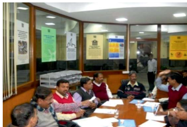
The Facilitation Process

The Institute has been providing advice and consultancy to existing and potential entrepreneurs and EDP organizations in their multi-faceted activities. It thus helps the cause of promotion/development of entrepreneurship in the society. The year saw more than five hundred existing/potential entrepreneurs; developmental organizations/ institutes being benefited from the guidance provided by the Institute. The majority of potential entrepreneurs were guided, evinced keen interest in commencing their own economic ventures through these bodies/agencies.