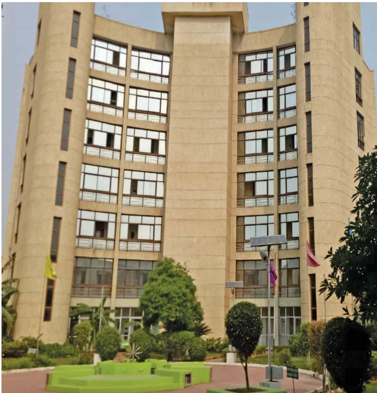
The Central Vista and Hostel Block

done in a very decentralized and flexible manner during the skill trainings, and yet it should be able to maintain the quality uniformly. Hence, it was recommended to NIESBUD to prepare an end to end customized orientation module for PMKVY which would need only one day customized orientation by the VTP for which the Training Partner needs to be appropriately oriented and trained.