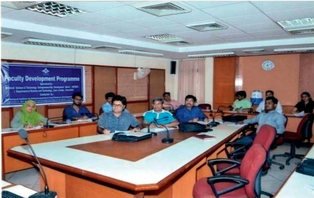
A section of the participants of Faculty Development Programme

entrepreneurial career. A total 10 Faculty Development Programmes for 200 faculties from different colleges and universities, sponsored by the National Science and Technology Entrepreneurship Development Board (NSTEDB), were organized at NIESBUD.