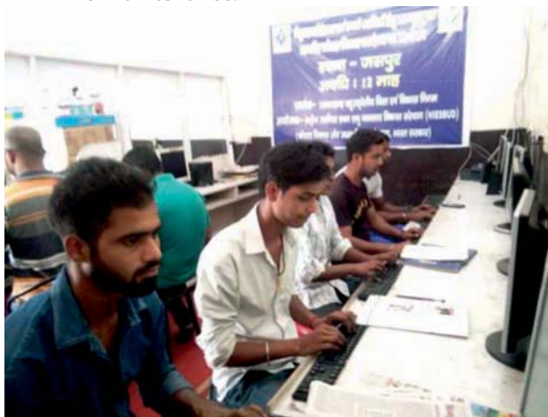
The Computer Literacy

The Institute has organized Eight (8) Entrepreneurship and Skill Based Training Programmes (ESDP) for minority participants in Ten (10) districts of Uttarakhand viz. Almora, Chamoli, Dehradun, Haridwar, Nainital, Pauri Garhwal, Rudraprayag and Uttarkashi in the year 2016-17. The programmes were sponsored by Uttarakhand Alpsankhyak Kalyan Tatha Wakf Vikas Nigam (UMWDC). In all 200 Trainees were trained in different trade viz. Computer Accounting with Tally (CAWT) Fashion Designing (FASD) Apian Art, Mushroom Cultivation, Sheet Metal & Fabrication, Woolen Shawl, Food Processing, Bamboo Craft and Electrical Repair & Maintenance.