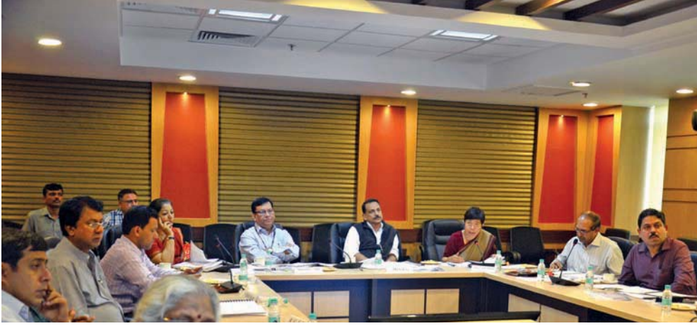
संचालन परिषद की बैठक

महानिदेशक, निसबड ने दिनांक 26 अक्टूबर, 2016 को आयोजित 74वीं कार्यकारिणी समिति की बैठक में लिए गए निर्णयों एवं अनुशेषाओं को प्रस्तुत किया। इस पर निम्नलिखित टिप्पणियाँ की गईं:-