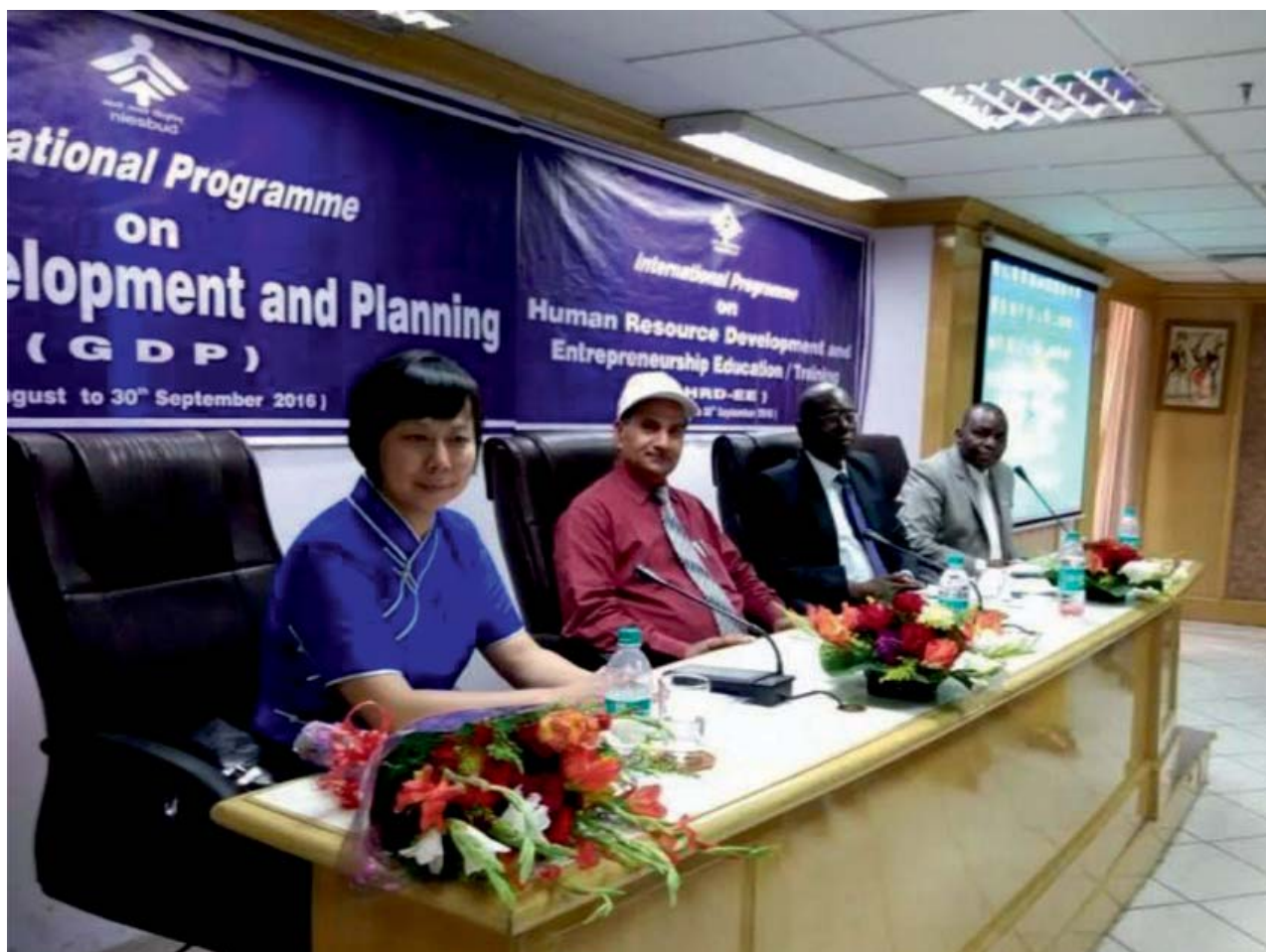
Two International Training Programmes being inaugurated

The Institute organized the twenty-sixth International Training Programme on SBPP which was attended by 28 participants. In order to provide comprehensive coverage to