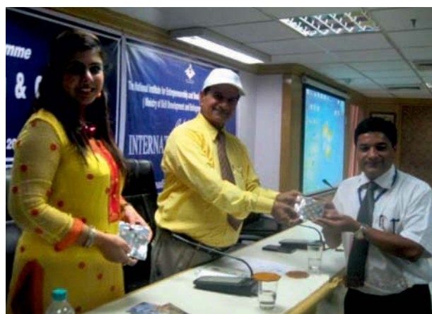
Felicitating an International Participant

International Training Programme on Innovative Leadership for organization