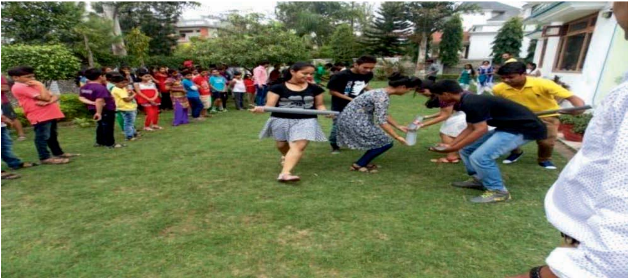
ग्रीष कालीन कैम्प

संस्थान ने परेड ग्राउंड, देहरादून, उत्तराखंड में 18-10-2016 से 28-10-2016 तक हिमालय सरस मेला 2016 में निःशुल्क स्टाल देकर प्रशिक्षित हिताधिकारियों/स्वयं सहायता समूहों/महिला उद्यमियों को विपणन का मंच प्रदान किया। इसका मुख्य उद्देश्य ग्रामीण व्यक्तियों की आर्थिक स्थिति को सशक्त करने एवं राज्य के स्वयं सहायता समूह को संरक्षण प्रदान कर उन्हें जीविका के अवसर प्रदान करना था। इस सरस मेले ने सभी कारीगरों को उनके उत्पादों के विपणन का अवसर प्रदान किए। यह सरस मेला उत्तराखंड सरकार की एक पहल है जो प्रदर्शनियों के माध्यम से ग्रामीण कारीगरों को उनके उत्पादों के विक्री हेतु एक मंच प्रदान करता है।