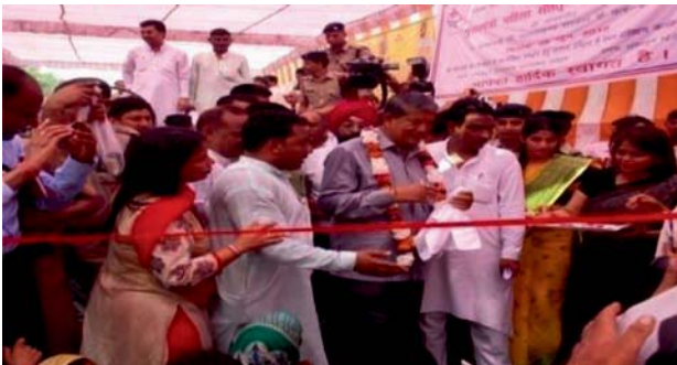
तत्कालीन माननीय मुख्यमंत्री श्री हरीश रावत, उत्तराखंड कार्यक्रम का उद्घाटन करते हुए

राष्ट्रीय उद्यमिता एवं लघु व्यवसाय विकास संस्थान (निसबड), देहरादून ने वर्ष 2016-17 के दौरान देहरादून उत्तराखंड में उद्यमशीलता पर पाँच (5) संकाय विकास कार्यक्रम आयोजित किए। इस प्रशिक्षण कार्यक्रम में कुल एक सौ ग्यारह (111) प्रतिभागियों ने भाग लिया। इस प्रशिक्षण कार्यक्रम का उद्देश्य देश के महाविद्यालय एवं संस्थानों में उद्यमशीलता की संस्कृति को बनाए रखना था।