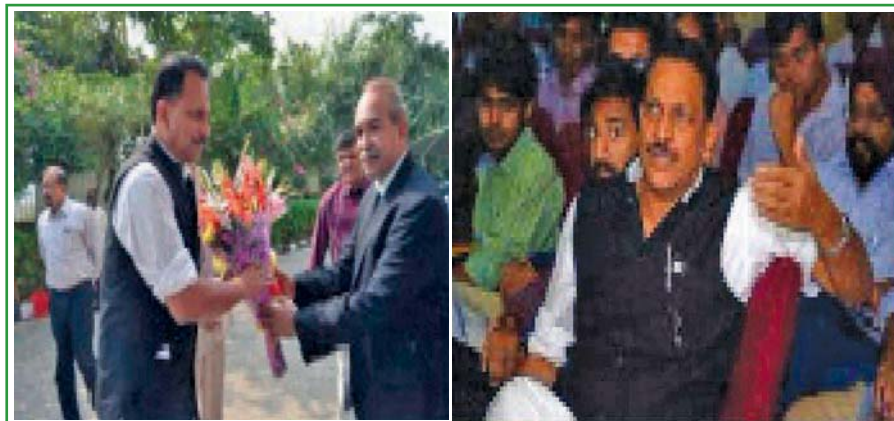
Shri Rajiv Pratap Rudy, the then Hon'ble Minister of State (Independent Charge), Skill Development and Entrepreneurship (MSDE) during Visit to NOIDA Campus