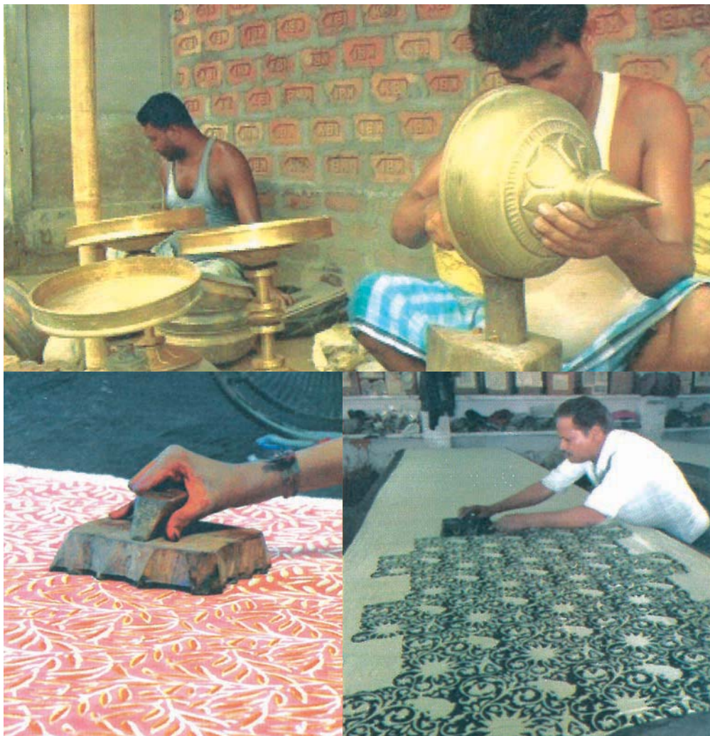
The Brass ware Cluster, Moradabad and Textile Printing Cluster, Pilkhuwa, Hapur

The Institute has initiated action for setting up five Livelihood Business Incubators (LBI) focusing on Mobile Repairing, Fashion Designing, Beautician, Food Processing and Electronics at its NOIDA Campus under ASPIRE Scheme of M/o MSME. The objective of the LBIs is to create jobs at local level and reduce un-employment through the creation of a favorable ecosystem for entrepreneurship development.