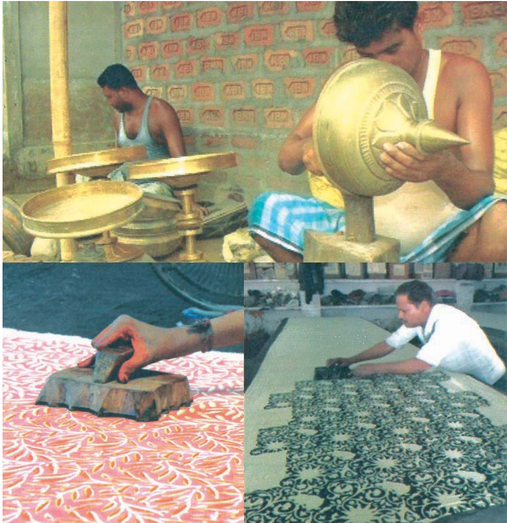
ब्रास्वेयर कलस्टर, मुरादाबाद तथा टेक्सटाईल प्रिंटिंग कलस्टर, पिलखुआ, हापुड़

संस्थान ने मोबाइल रिपेयरिंग पर ध्यान केन्द्रित करते हुए, पाँच आजीविका व्यवसाय इन्क्यूबेटर (एलबीआई) स्थापित करने के लिए कार्यवाही शुरू की है। एमएसएमई मंत्रालय की एसपीआईआई योजना के तहत नौएडा और अपने परिसर में फेशन डिजाइनिंग, ब्यूटीशियन, फूड प्रोसेसिंग, और इलेक्ट्रानिक्स (एलबीआईएस) का उद्देश्य, उद्यमिता विकास के लिए एक अनुकूल परिस्थितिकी तंत्र के निर्माण के माध्यम से स्थानीय स्तर पर नौकरियाँ पैदा करना और बेरोजगारी को कम करना है।