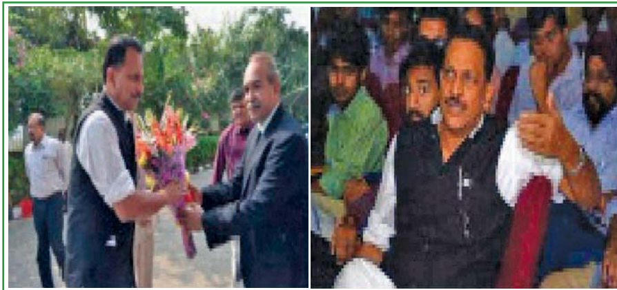
श्री राजीव प्रताप रूडी, तत्कालीन माननीय राज्य मंत्री (स्वतंत्र प्रभार), कौशल विकास एवं उद्यमशीलता (एमएसडीई), नोएडा परिसर के दौरे पर