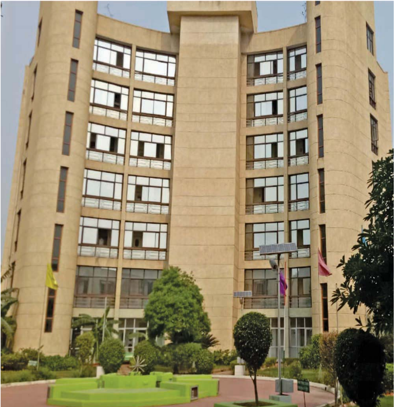
केन्द्रीय विस्ता एवं होस्टल ब्लाक

प्रशिक्षण के दौरान अधिकांशतः विकेन्द्रीकरण एवं लचकदार तरीके एवं उसमें भी एक समान गुणवत्ता बनाई जाए, इसीलिए निसबड से यह सिफारिश की गई है कि वह पीएमकेवीवाई के लिए पूर्णतः ग्राहकोन्मुख अनुकूलन मॉड्यूल तैयार करे जिससे बीटीपी द्वारा केवल एक दिन के प्रशिक्षण-ग्राहकोन्मुख अनुकूलन की जरूरत होगी, साथ ही, साझीदार को भी उचित रूप से अनुकूलन एवं प्रशिक्षण दिया जाए।