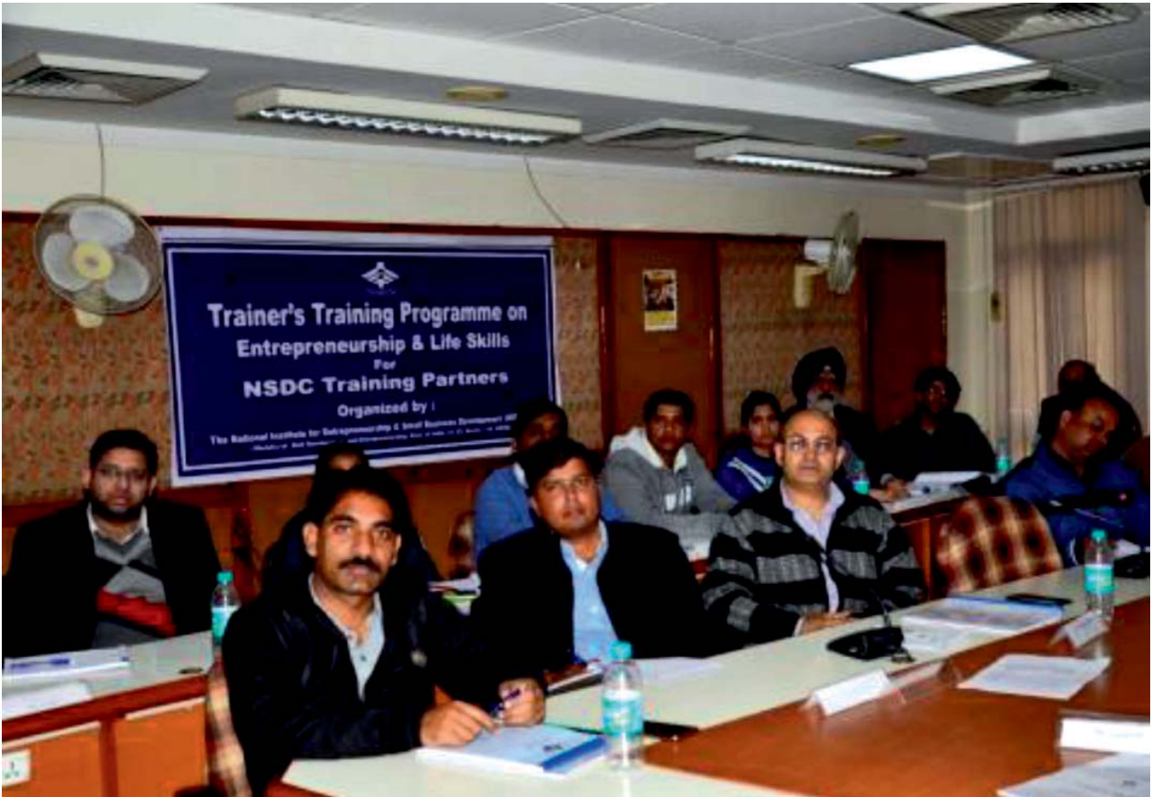
नियोजिता, उद्यमिता एवं जीवन कलाओं पर प्रशिक्षकों का प्रशिक्षण कार्यक्रम, नौएडा परिसर में

संकाय विकास कार्यक्रम (एफडीपी) को उद्यमशीलता विकास के पेशेवरों को प्रशिक्षण एवं विकसित करने के लिए डिजाइन किया गया है, जिससे वे नौजवान एस व टी व्यक्तियों को उद्यमी के तौर पर, अपने कैरियर बनाने वालों को मार्गदर्शन एवं प्रेरित करने हेतु रिसोर्स व्यक्ति के तौर पर कार्य कर सकें. इसका लक्ष्य, प्रशिक्षकों को कौशल एवं ज्ञान प्रदान