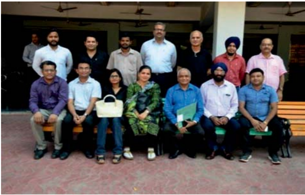
प्रशिक्षण कार्यक्रम: वित्त कैसे जुटाएं एवं जोखिम कैसे कम करें पर

संस्थान ने निर्यात प्रक्रिया-दस्तावेजीकरण एवं अन्तर्राष्ट्रीय उद्यमिता पर 10 कार्यक्रम आयोजित किए जिसमें 166 प्रतिभागियों को प्रशिक्षित किया गया। उद्यमियों की वित्तीय स्थिति को सशक्त करने हेतु "वित्त कैसे जुटाएं" एवं "जोखिम कम कैसे करें" के 08 कार्यक्रमों का भी आयोजन किया जिससे 119 प्रशिक्षणार्थी लाभान्वित हुए। वर्तमान शॉपिंग परिदृश्य एवं उनकी विपणन क्षमताओं को बढ़ाने को देखते हुए, इन कार्यक्रमों से 505 प्रतिभागियों के लाभार्थ ऑनलाइन विपणन एवं उद्यमिता पर 41 कार्यक्रमों को आयोजित किया गया।