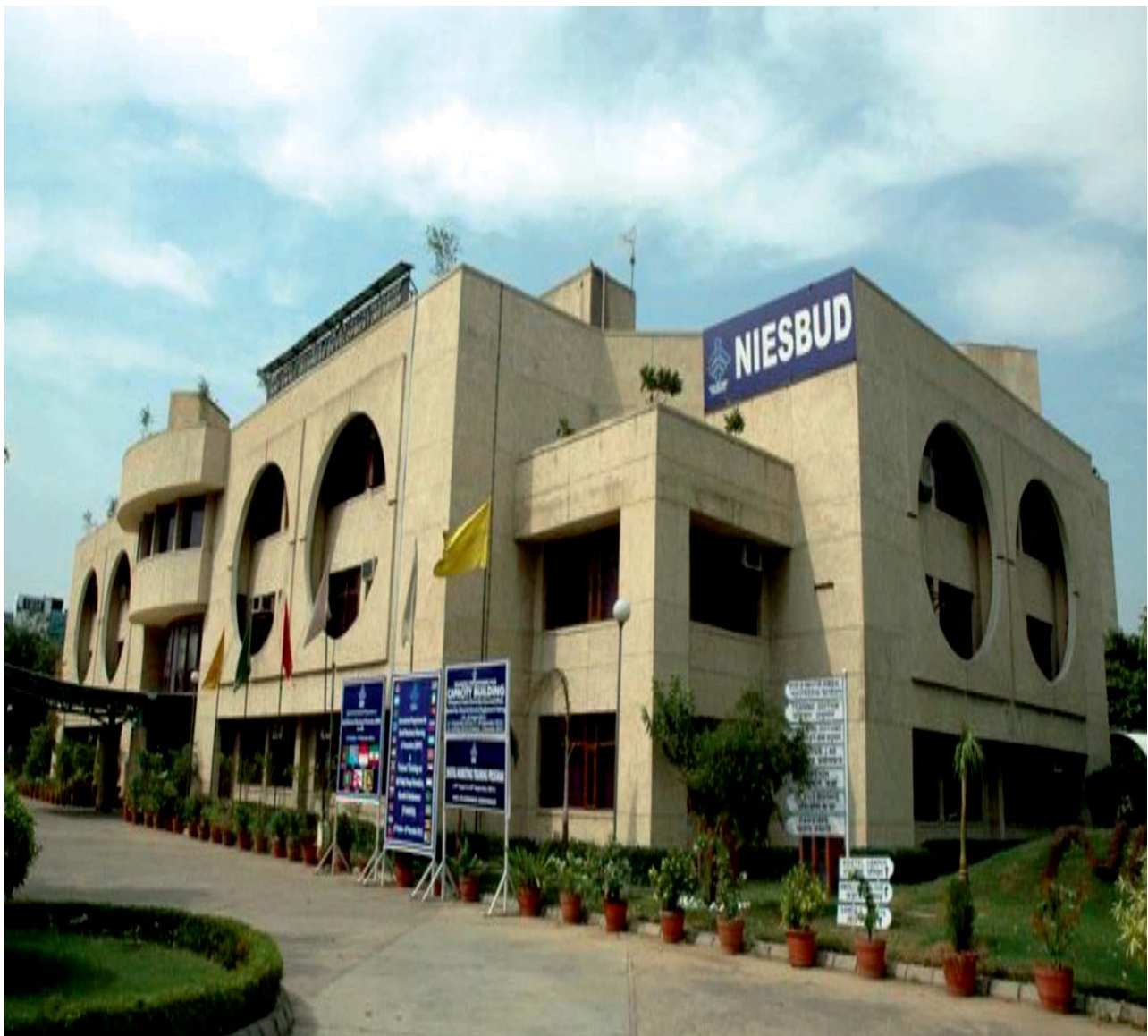
The NOIDA Campus

1.8 The Institute is operating from an integrated Campus in Sector-62, NOIDA, NCR of Delhi. It is about 20 kms from the city center of Delhi. The campus is spread in an area of 10,000 sq. meters with about 60,000 sq. feet of built up area. It has 8 classrooms, 1 auditorium, and 1 conference hall, besides a library, a hostel with 32 twin-sharing rooms and other facilities. The Regional Office, Dehradun of the Institute is operating from rented accommodation. It has two classroom and other facilities.